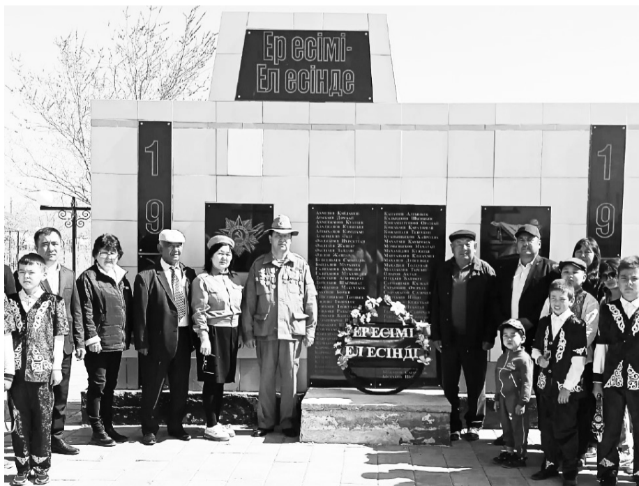
жазылған ескерткіш тақтаға гүл шоқтарын қойып, бір минут

Әдеттегідей, айтулы мерекені алдымен осы саябаққа қойылған соғыс ардагерлерінің есімдері